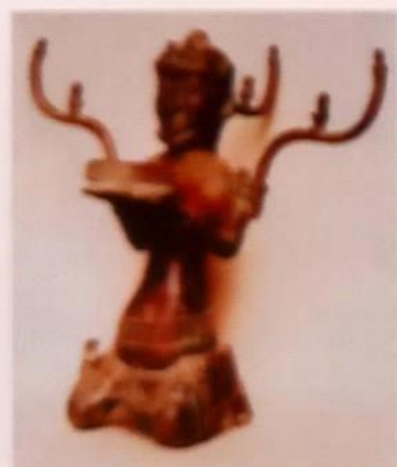
Bù hình đồ chơi, tranh sơn mài đồ chơi thế kỷ ở nước Cộng người Tượng người lao động sơn mài thế kỷ ở nước Cộng người